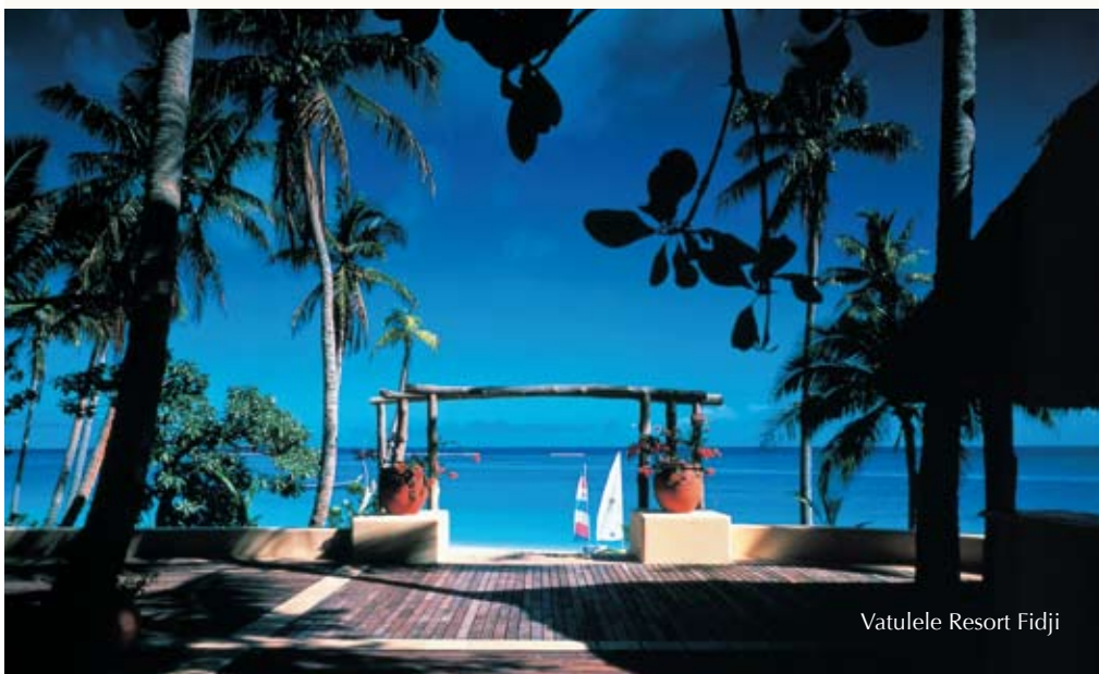
Vatulele Resort Fidji

DÍA 17:LONDRES - ESPAÑA. Llegada y fin del viaje.